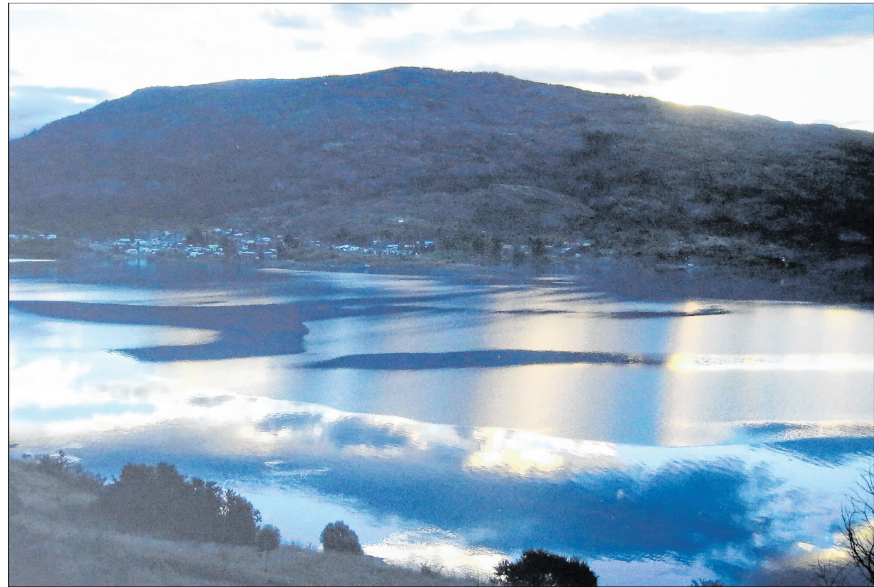
„Lago General Carreras III“, eine Fotografie von Mechthild Ilchmann in der Heilsbronner Ausstellung „Vision und Wirklichkeit“.

Die Liebe und Begeisterung, die sowohl Montecino als auch Ilchmann für Patagonien empfinden, ist deutlich spürbar. Auch die Fotografien verraten etwas von der Ursprünglichkeit dieser wilden Natur,